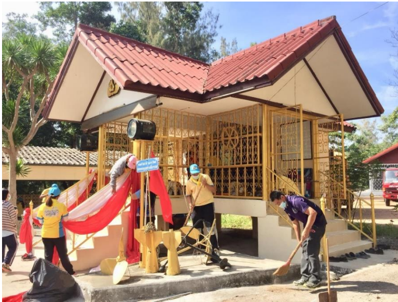
กิจกรรมจิตอาสา ณ พระตำหนักเสด็จในกรมหลวงชุมพร บ้านมาบอำมฤต